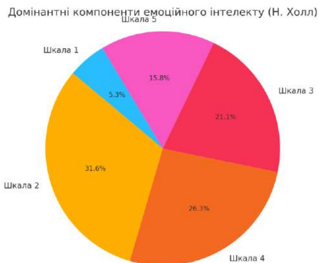
Рисунок 2.4. Домінантні компоненти емоційного інтелекту (Н. Холл)