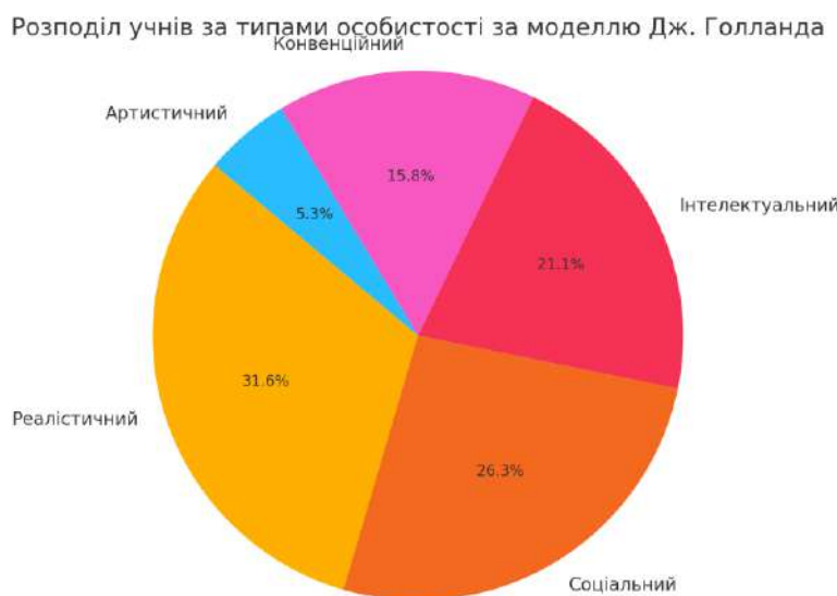
Рисунок 2.2. Розподіл учнів за типами особистості за моделлю Дж. Голланда

Такий результат повністю узгоджується з даними, отриманими за методикою Є.О. Йовайші, де провідними сферами виявились робота з людьми, розумова праця та робота з людьми на виробництві.