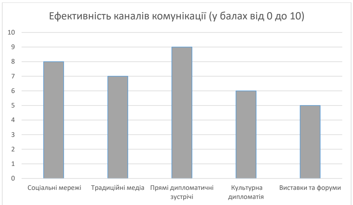
Рис 3: Ефективність каналів комунікації (у балах від 0 до 10)

Ця діаграма ілюструє, які канали є найбільш ефективними для досягнення цільової аудиторії. Вона допоможе підкреслити логіку вибору інструментів комунікації у межах стратегії. Це допоможе деталізувати потреби аудиторії. Дослідження поведінки цільової аудиторії також допомагає зрозуміти, як люди взаємодіють із комунікаційними матеріалами. Цим методом дається оцінка ефективності контенту (відео, статей, соціальних медіа) та визначаються найпопулярніші формати і канали комунікації. Для дослідження цим методом використовується веб-аналітика (Google Analytics, Hotjar) та аналіз взаємодій у соціальних мережах (лайки, коментарі, поширення).