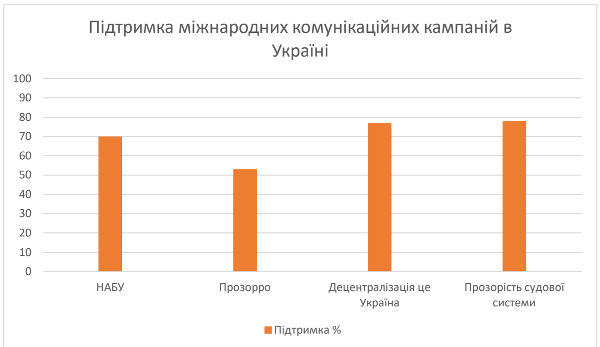
Рис 1: Підтримка міжнародних комунікаційних кампаній в Україні

Одна з головних проблем міжнародних кампаній – необхідність врахування культурного різноманіття цільової аудиторії. Маседжі, які є ефективними в одній країні, можуть бути нерелевантними або навіть неправильно сприйнятими в іншій через культурні відмінності. Наприклад, у європейських країнах споживачі можуть віддавати перевагу прямим і чесним повідомленням, тоді як в азійських культурах важливішим є тонкий і ввічливий підхід.