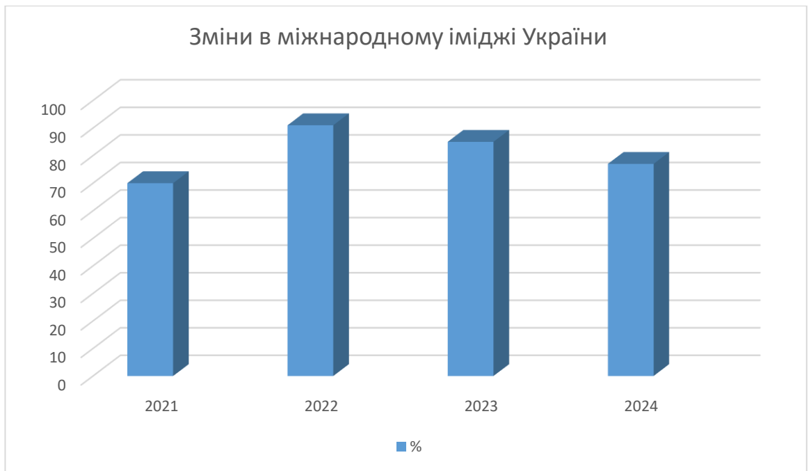
Рис 2: Зміни в міжнародному іміджі України

Міжнародний імідж України формується на основі успіхів реформ та демократичних перетворень. Прогрес у сферах децентралізації, боротьби з корупцією та економічної модернізації відіграє важливу роль у сприйнятті України як сучасної та реформаторської держави. Однак повільність окремих реформ та системні проблеми залишаються значними викликами для зміцнення міжнародного іміджу. Військовий конфлікт з Росією став однією з ключових тем, що визначають міжнародне сприйняття України. З одного боку, це позиціонує Україну як форпост демократії, який бореться за свободу та незалежність, з іншого боку — обмежує економічний розвиток та реформи. Ефективна комунікація досягнень реформ, протидія дезінформації та популяризація української культури сприяють покращенню міжнародного образу країни. Водночас існує потреба у вдосконаленні стратегій інформаційної політики, зокрема через цифрові платформи і соціальні мережі. Україна сприймається як стратегічний партнер у ЄС і США, де акцент робиться на підтримці демократичних перетворень та безпеки. В Азії пріоритетом є економічне співробітництво, тоді як у країнах, що розвиваються, домінують гуманітарні питання. Ці регіональні відмінності