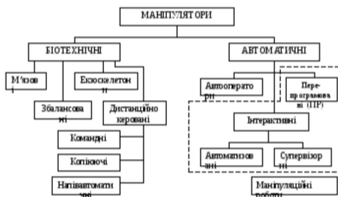
Рис. 1.24. Схематичне зображення класифікації маніпуляторів

які виносять у підпис, супроводжуючи їх текстом. Треба зазначити, що експлікація не замінює загального найменування сюжету, а лише пояснює його. Приклад: