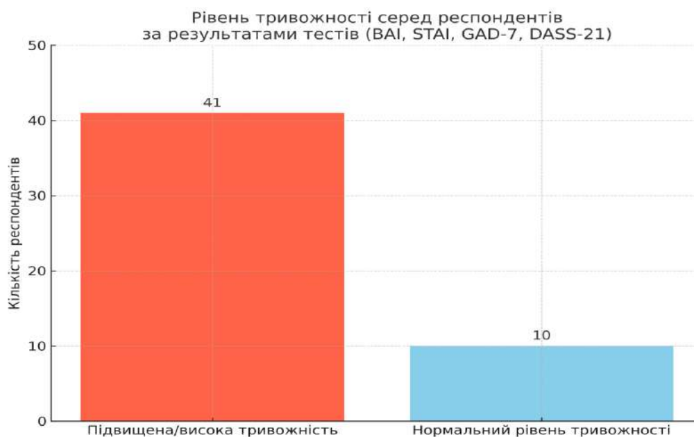
Рис.2.1. Рівень тривожності серед респондентів (за результатами BAI, STAI, GAD-7, DASS-21)

Загальний аналіз результатів показав, що у 80% респондентів (41 особа) щонайменше за двома з чотирьох використаних тестів – BAI, STAI, GAD-7, DASS-21 – було зафіксовано підвищений або високий рівень тривожності. Це підтверджує актуальність вивчення захисних механізмів саме в умовах емоційного напруження (рис.2.1).